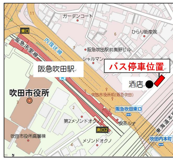
「阪急吹田駅前」【12月4日～】