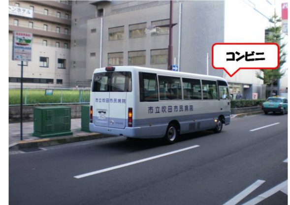
⑤コンビニの手前の空き地前