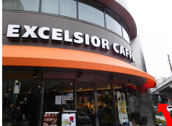
④カフェを左手に回り込み直進する