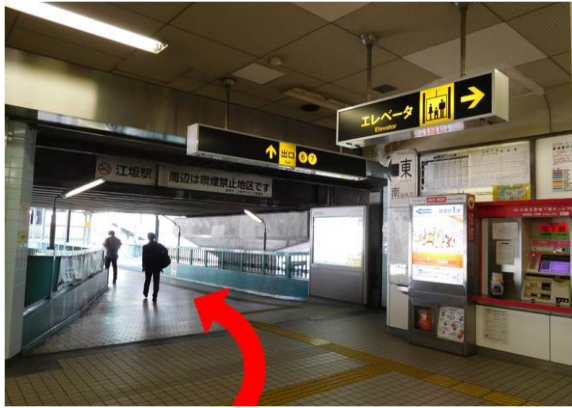
①江坂駅南改札口を左手に進む