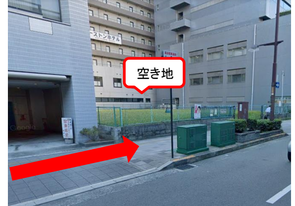
⑤空き地前まで進む(約25m程)